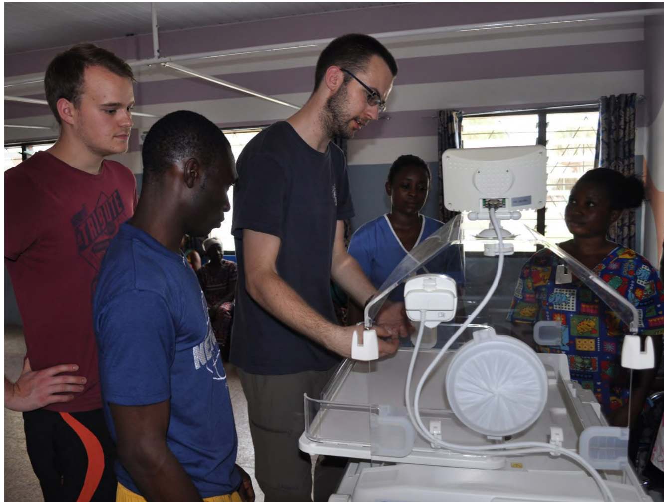
Als ehrenamtlicher Dienstleister übernahm TeoG das Testen und den Aufbau der Einrichtung sowie die Einweisung des Personals

» steine. Das Ergebnis: die Zahl der Frauen, die Verhütungsmittel nutzen, steigt seitdem stetig an.