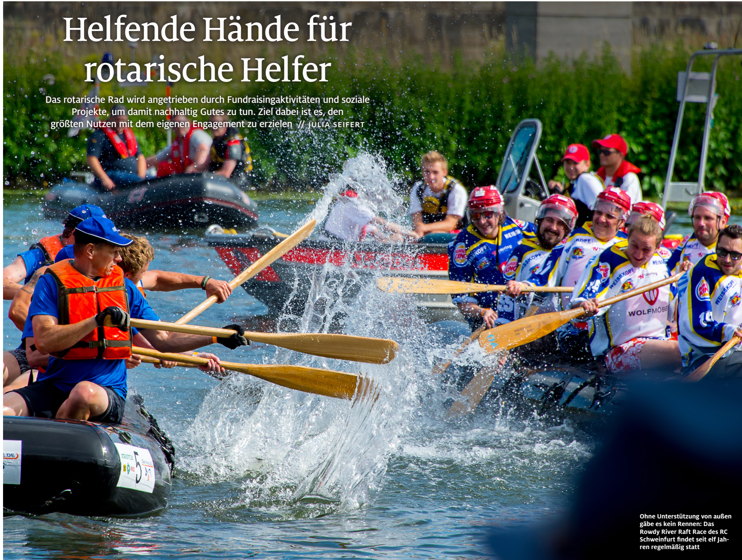
Ohne Unterstützung von außen gäbe es kein Rennen: Das Rowdy River Raft Race des RC Schweinfurt findet seit elf Jahren regelmäßig statt

Das rotarische Rad wird angetrieben durch Fundraisingaktivitäten und soziale Projekte, um damit nachhaltig Gutes zu tun. Ziel dabei ist es, den größten Nutzen mit dem eigenen Engagement zu erzielen // JULIA SEIFERT