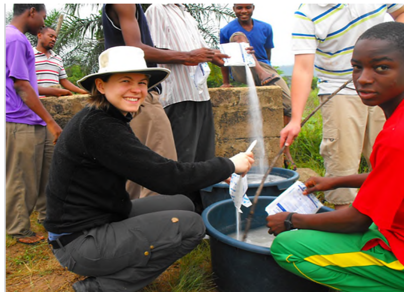
TeoG versucht statt einer teuren Brunnenbohrung eine Regenerierung des Brunnens vorzunehmen

Aber auch das rotarische Engagement im unmittelbaren Clubeinzugsgebiet hat es einfacher, wenn auf Erfahrungen und Hilfestellungen in bestehenden Netzwerken zurückgegriffen werden kann und bestenfalls sogar Kooperationen für eine Umsetzung entstehen. Vorhandene Ressourcen sind so effektiver nutzbar. ●