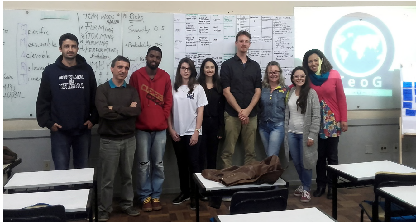
Der in Deutschland regelmäßig 4-mal im Jahr durchgeführte Projektleiter-Workshop ist mittlerweile bereits mehrfach in Englisch auch in Ghana, Brasilien (Foto) und Uganda durchgeführt worden.

» In Absprache mit dem Verein Wasser ohne Grenzen e.V. (WoG) wurde in diesem Jahr der Entwurf eines Abwasser-Handbuchs erarbeitet, das verschiedene Toilettentypen und Abwasserbehandlungssysteme vorstellt und miteinander vergleicht. Dies dient den TeoG eigenen wie auch rotarischen WASH-Projekten.