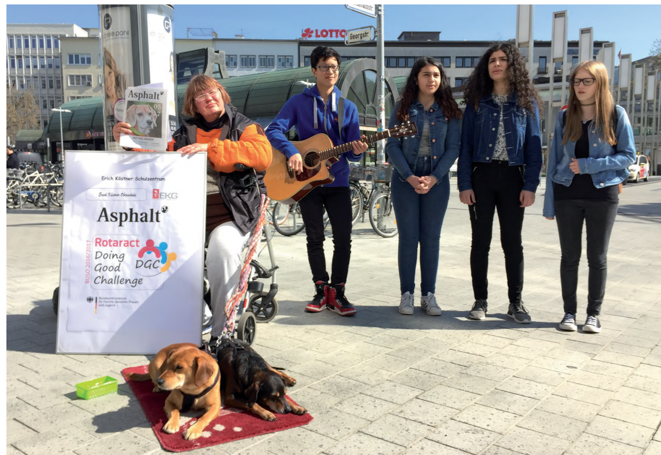
Bei der Doing Good Challenge veranstalten Jugendliche selbstorganisierte soziale Aktionen. Die X-Singers unterstützen beim Verkauf eines sozialen Straßenmagazins.

Auch wurde zusammen mit dem Marketinglehrstuhl der Hochschule Trier eine Studie zum Thema „Jugendmarketing“ durchgeführt. Auf Grundlage der Ergebnisse einer Befragung von über 250 Jugendlichen, Lehrern und Eltern entwickelte das Hochschulteam zusammen mit dem Doing Good Challenge-Vorstand ein neues Konzept, um Jugendliche in Zukunft