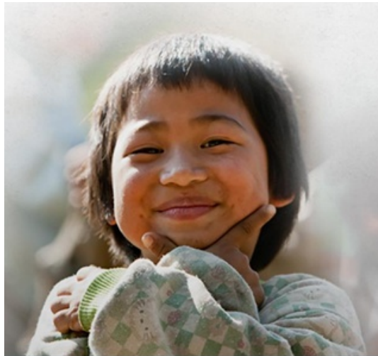
„Handeln, wo die Not am größten ist“ (TRF)